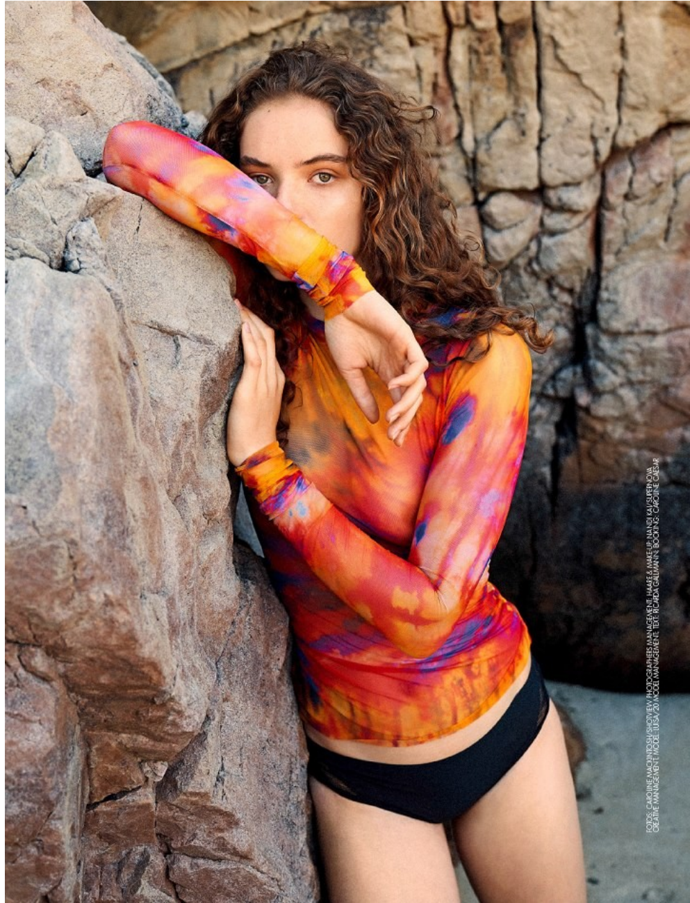
HAIR & MAKEUP: NANDI KAI / SUPERNOVA CREATIVE MANAGEMENT, MODEL: TUSKA / DOLCE MANAGEMENT, TEXT: NICOLA GARDINER / BOOKING: CAROLINE CREAR